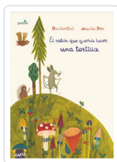
RATON QUE QUERIA HACER UNA TORTILLA, EL CALI, DAVIDE