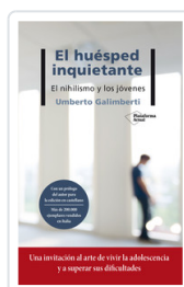
HUESPED INQUIETANTE, EL GALIMBERTI, UMBERTO