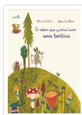
RATON QUE QUERIA HACER UNA TORTILLA, EL CALI, DAVIDE