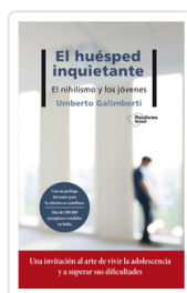
HUESPED INQUIETANTE, EL GALIMBERTI, UMBERTO