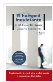
HUESPED INQUIETANTE, EL GALIMBERTI, UMBERTO