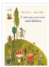
RATON QUE QUERÍA HACER UNA TORTILLA, EL CALÍ, DAVIDE