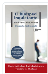
HUESPED INQUIETANTE, EL GALIMBERTI, UMBERTO