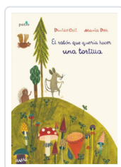
RATON QUE QUERIA HACER UNA TORTILLA, EL CALÌ, DAVIDE