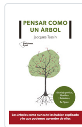
PENSAR COMO UN ARBOL TASSIN, JACQUES