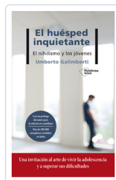
HUESPED INQUIETANTE, EL GALIMBERTI, UMBERTO