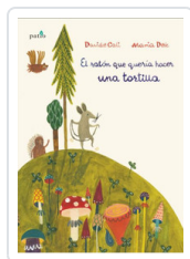
RATON QUE QUERIA HACER UNA TORTILLA, EL CALI, DAVIDE