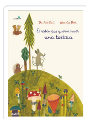
RATON QUE QUERIA HACER UNA TORTILLA, EL CALI, DAVIDE