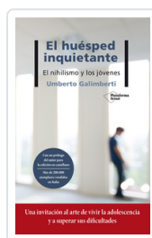
HUESPED INQUIETANTE, EL GALIMBERTI, UMBERTO