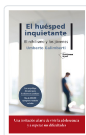
HUESPED INQUIETANTE, EL GALIMBERTI, UMBERTO