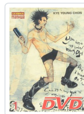
DVD, 1 YOUNG, KYE