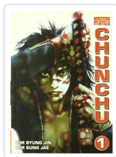
CHUNCHU, 1 BYUNG, KIM