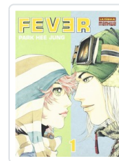
FEVER, 1 HEE, PARK