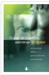
CURAR EL CUERPO ELIMINAR DOLOR SARNO, JOHN