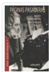
THE SEARCHERS, 1 PAGINAS PASADERAS