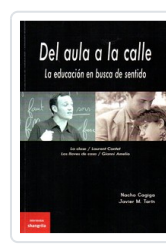
DEL AULA A LA CALLE CAGIGA, N.