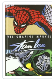
VISIONARIOS MARVEL: STAN LEE