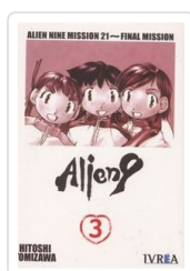
ALIEN 9, 3 TOMIZAWA, HITOSHI