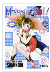
MAHOTSUKAI TAI, 2 SHAMNEKO, JUNICHI