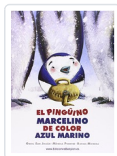
PINGUINO MARCELINO COLOR AZUL MARINO SAN, ORIOL