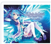
HADA DE CRISTAL, EL