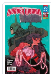
ABSOLUTE WONDER WOMAN, 2 AA.VV.