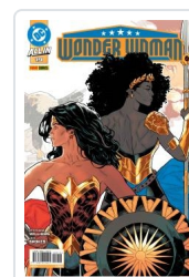
WONDER WOMAN, 3 AA.VV.