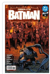
ABSOLUTE BATMAN, 2 AA.VV.