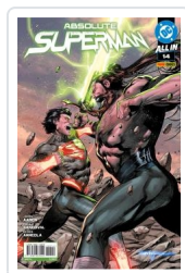
ABSOLUTE SUPERMAN, 2 AA.VV.