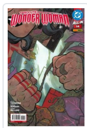
ABSOLUTE WONDER WOMAN, 2 AA.VV.