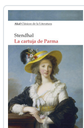
CARTUJA DE PARMA, LA STENDHAL