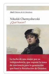
QUE HACER GAVRILOVICH, NIKOLAI