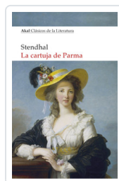
CARTUJA DE PARMÁ, LA STENDHAL