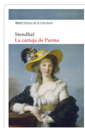
CARTUJA DE PARMA, LA STENDHAL