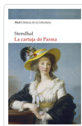
CARTUJA DE PARMA, LA STENDHAL