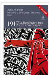
1917 LA REVOLUCION RUSA CIENT AÑOS DESPUES BLANCO, JUAN ANDRADE