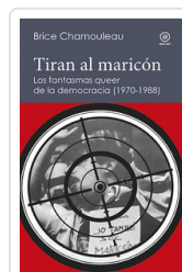
TIRAN AL MARICON CHAMOLEAU, BRICE