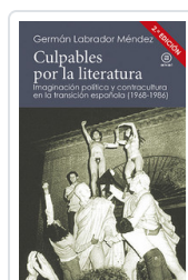
CULPABLES POR LA LITERATURA LABRADOR, GERMAN