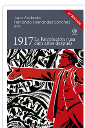
1917 LA REVOLUCION RUSA CIENT AÑOS DESPUES BLANCO, JUAN ANDRADE