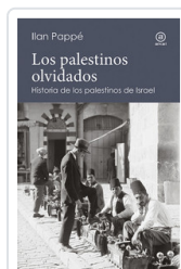
PALESTINOS OLVIDADOS, LOS PAPPE, ILAN