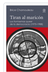
TIRAN AL MARICON CHAMOULEAU, BRICE