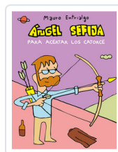
ANGEL SEÑA PARA ACERTAR LOS CATORCE ENTRIALGO, MAURO