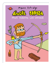
ANGEL SEFIJA PARA ACERTAR LOS CATORCE ENTRIALGO, MAURO