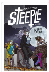
STEEPLE, 2 LA LUNA PLATEADA ALLISON, JOHN