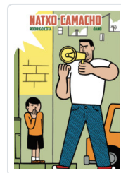
NATXO CAMACHO (CATALAN) COTA, RODRIGO