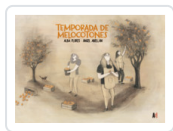
TEMPORADA DE MELOCOTONES FLORES/ ABELLAN