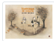
TEMPORADA DE COLLITA (CATALAN) FLORES/ ABELLAN