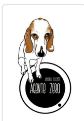
AGENTE ZERO CASAOS, MARINA