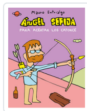
ANGEL SEÑA PARA ACERTAR LOS CATORCE ENTRIALGO, MAURO