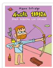
ANGEL SEÑA PARA ACERTAR LOS CATORCE ENTRIALGO, MAURO