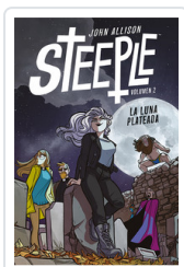
STEEPLE, 2 LA LUNA PLÁTEADA ALLISON, JOHN