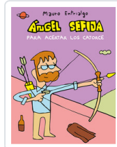
ANGEL SEFIJA PARA ACERTAR LOS CATORCE ENTRIALGO, MAURO