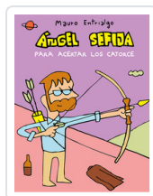
ANGEL SEFIJA PARA ACERTAR LOS CATORCE ENTRIALGO, MAURO