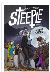
STEEPLE, 2 LA LUNA PLATEADA ALLISON, JOHN