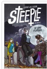
STEEPLE, 2 LA LUNA PLATEADA ALLISON, JOHN