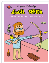
ANGEL SEFIJA PARA ACERTAR LOS CATORCE ENTRILGO, MAURO