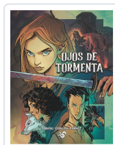
OJOS DE TORMENTA CORDERO/ CARRASCO/ RAMIREZ