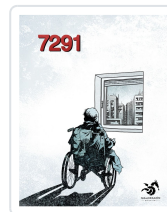
7291. SIETE MIL DOSCIENTOS NOVENTA Y UNO AA.VV.