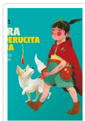
OTRA CAPERUCITA ROJA SCALITER, JUAN