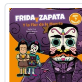
FRIDA Y ZAPATA Y LA FLOR DE LA MUERTE FINK/ SAA