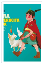
OTRA CAPERUCITA ROJA SCALITER, JUAN