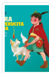
OTRA CAPERUCITA ROJA SCALITER, JUAN