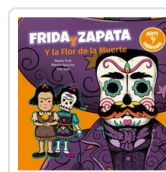
FRIDA Y ZAPATA Y LA FLOR DE LA MUERTE FINK/ SAA