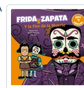
FRIDA Y ZAPATA Y LA FLOR DE LA MUERTE FINK/ SAA