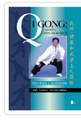
QIGONG SALUD Y ARTES MARCIALES YANG, JWING-MING