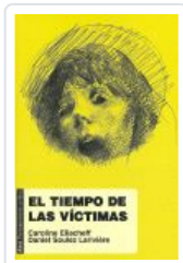
TIEMPO DE LAS VICTIMAS ELIACHEFF, CAROLINE