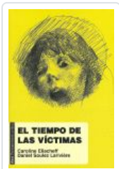
TIEMPO DE LAS VICTIMAS ELIACHEFF, CAROLINE