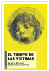
TIEMPO DE LAS VICTIMAS ELIACHEFF, CAROLINE