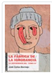
FABRICA DE LA IGNORANCIA BERMEJO, JOSE