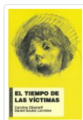
TIEMPO DE LAS VÍCTIMAS ELIACHEFF, CAROLINE