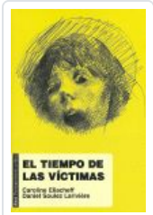
TIEMPO DE LAS VÍCTIMAS ELIACHEFF, CAROLINE