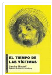
TIEMPO DE LAS VICTIMAS ELIACHEFF, CAROLINE