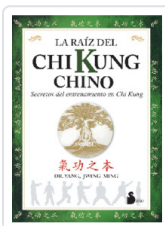
RAIZ DEL CHI KUNG CHINO YANG, JWING-MING