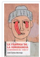
FABRICA DE LA IGNORANCIA BERMEJO, JOSE