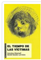
TIEMPO DE LAS VÍCTIMAS ELIACHEFF, CAROLINE