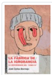
FABRICA DE LA IGNORANCIA BERMEJO, JOSE