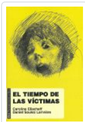
TIEMPO DE LAS VICTIMAS ELIACHEFF, CAROLINE