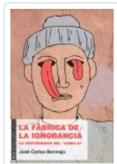
FABRICA DE LA IGNORANCIA BERMEJO, JOSE