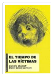
TIEMPO DE LAS VICTIMAS ELIACHEFF, CAROLINE