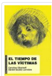
TIEMPO DE LAS VÍCTIMAS ELIACHEFF, CAROLINE