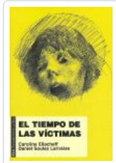
TIEMPO DE LAS VICTIMAS ELIACHEFF, CAROLINE