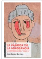
FABRICA DE LA IGNORANCIA BERMEJO, JOSE