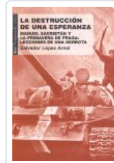
DESTRUCCION DE UNA ESPERANZA SACRISTAN, MANUEL