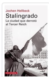
STALINGRADO (T) HELLBECK, JOCHEN