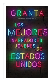
GRANTA ESPAÑOL NE, 8 MEJORES NARRADORES EE.UU. AA.VV.